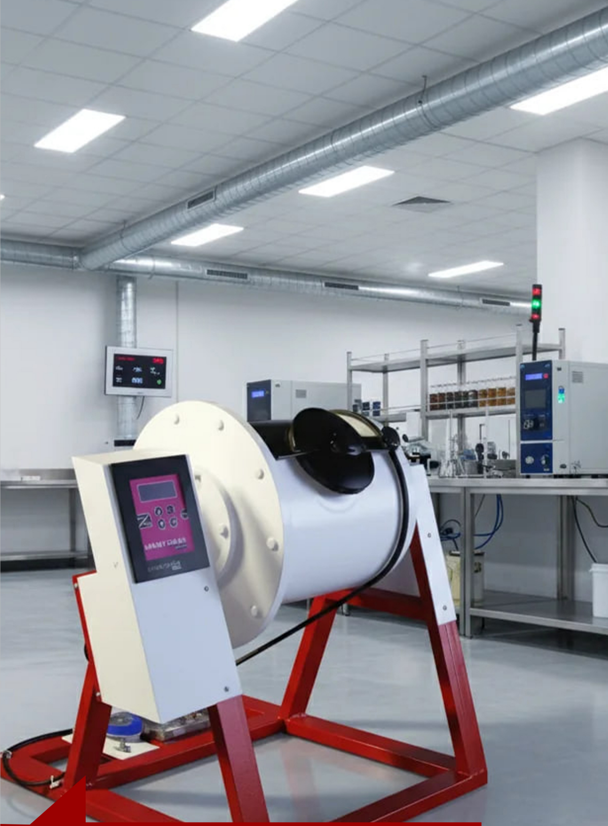
LAB TYPE BALL MILL